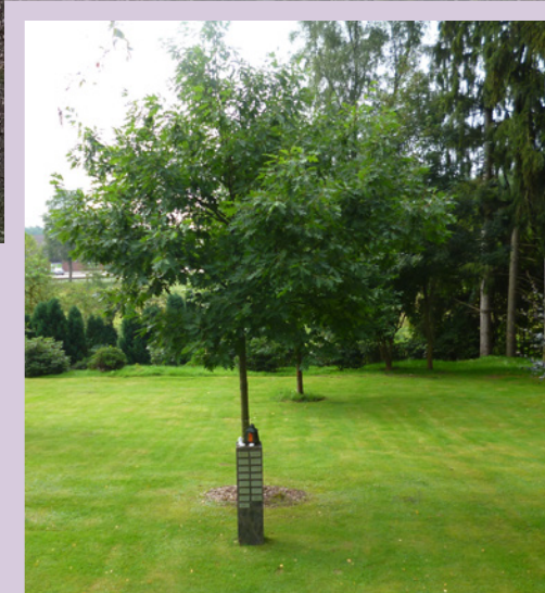
Baumbestattungsfeld inkl. Pflege