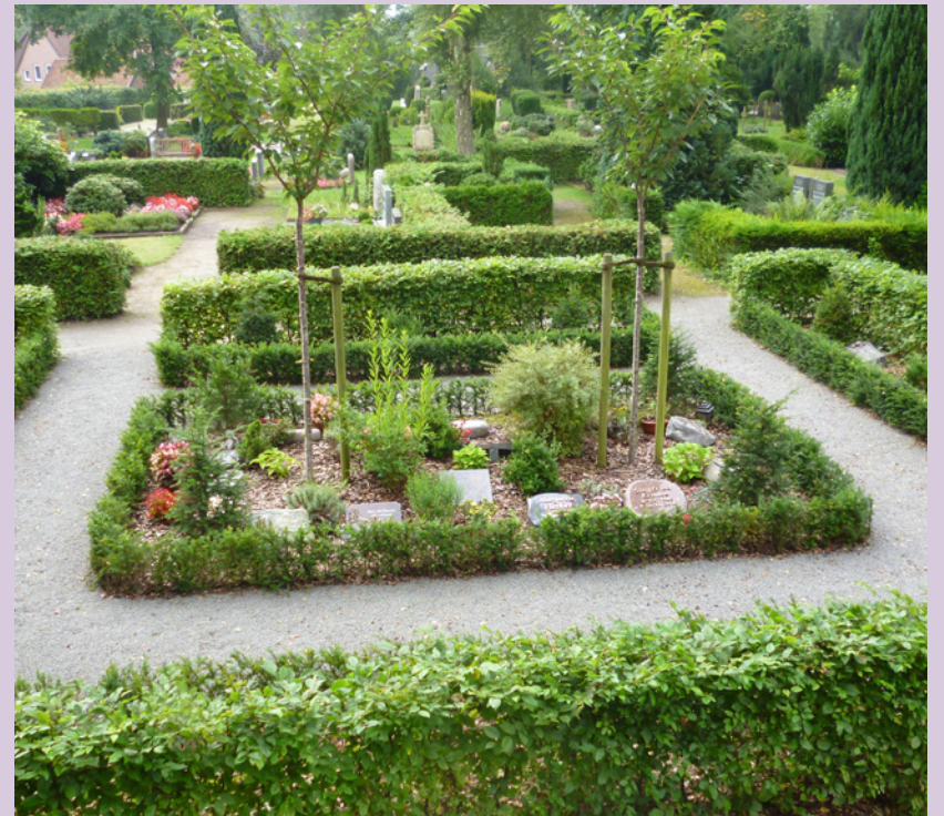
Gepflegtes Urnengrabfeld für 30 Jahre inkl. Pflege