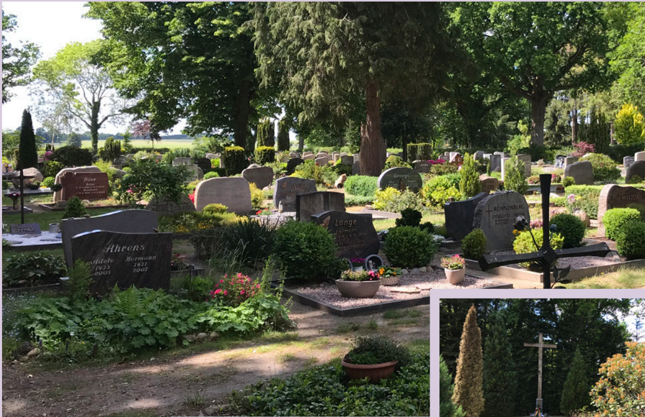
Einzel- oder Doppel- Wahlgrab