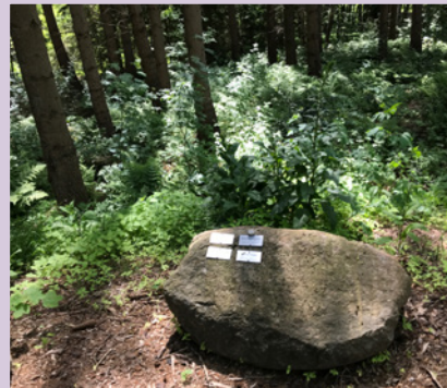
Brandenbusch Bestattung im naturbelassenen Wald