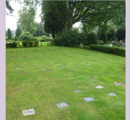
Unter dem grünen Rasen – Urnen- oder Erdbestattung inkl. Pflege